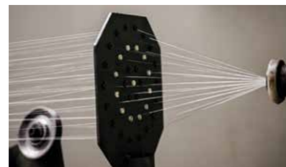
Kupferlitzen und Kupferseile